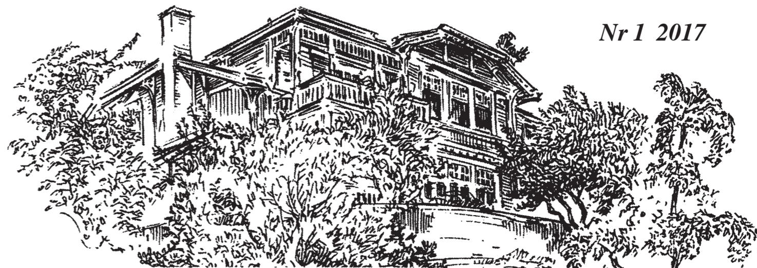
Saltskog Gård C.F Liljevalchs hem

Digitalprint: Södertälje Offset AB Tel: 08-550 161 20