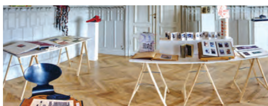
Bild från Artistsbookutställningen.